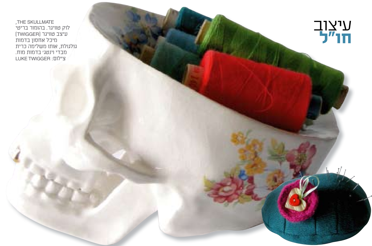
,THE SKULLMATE לוק טוויגר. בהומור בריטי עיצב טוויגר (TWIGGER) מיכל אחסון בדמות גולגולת, אותו משלימה כרית מבדי וינטג'י בדמות מוח.